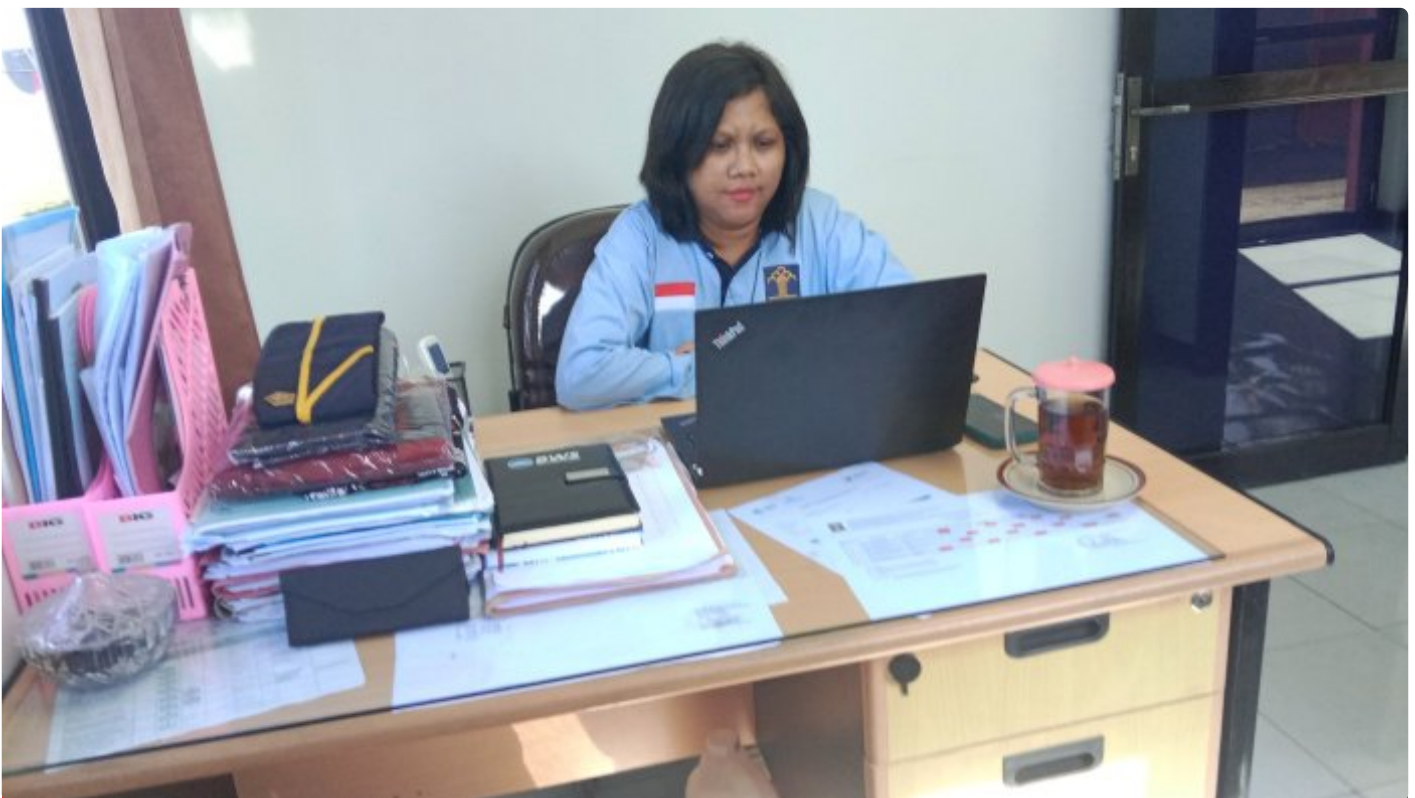
Humas Rupbasan Cilacap

Cilacap - Dalam rangka implementasi NIK menjadi NPWP, Direktorat Jenderal Pajak menggelar edukasi perpajakan secara virtual. Jumat (9/6/2023)